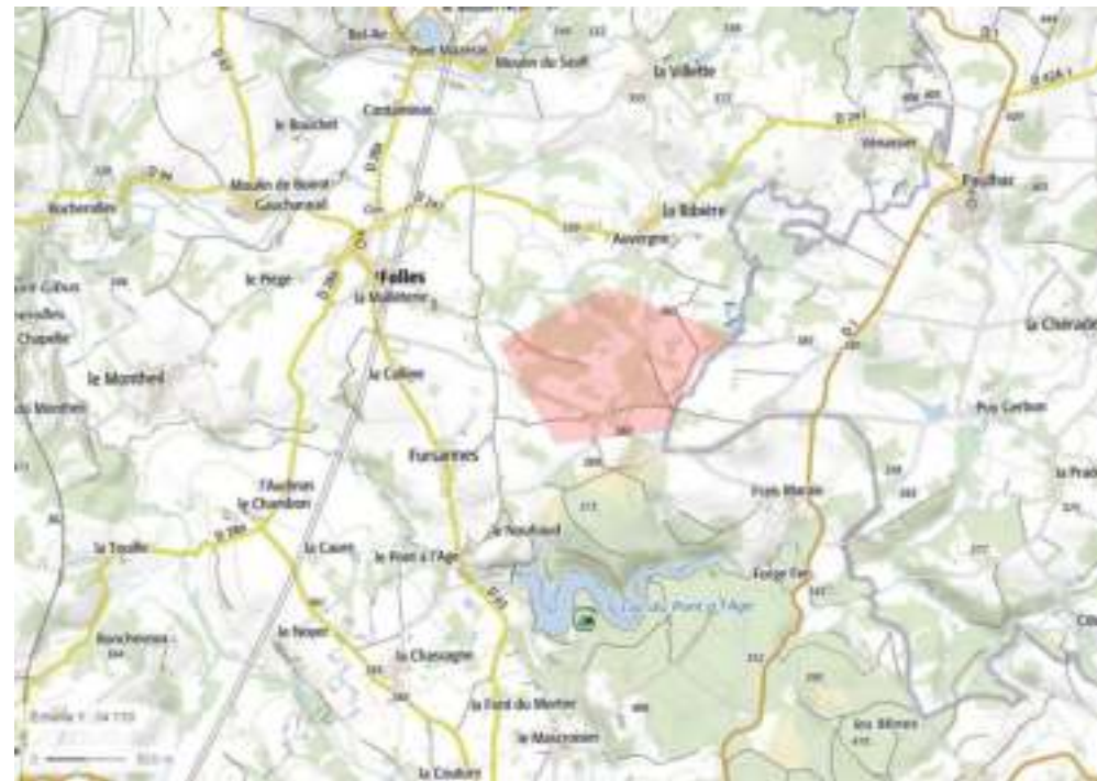
Site du Frais Marais

Nous serons impactés visuellement par les projets de MARSAC, ARRENES, ST PARDOUX où des mâts de mesure de vent sont déjà installés et visibles de part et d'autre de nos communes.