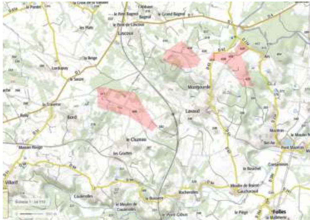
Sites du Cluzeau et Montjourde

FOLLES BAT TOUS LES RECORDS AVEC 3 SITES ET DOUZE ÉOLIENNES POTENTIELLES !